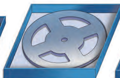
15" Rolle in 15" SmartCarrier Box