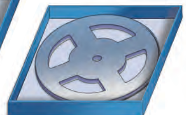
13" Rolle in 13" SmartCarrier Box