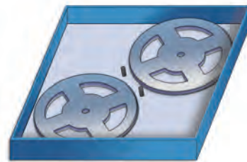
2 x 7" Rollen in 13" SmartCarrier Box