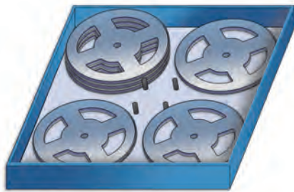
4 x 7" Rollen in 15" SmartCarrier Box

z. B. Kassette 56 mm/15" mit 20 x 7"/8 mm Rollen je SmarCarrier Box = 80 Rollen/Kassette